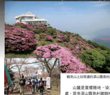
鶴見嶽山上站周圍的深山霧島杜鵑