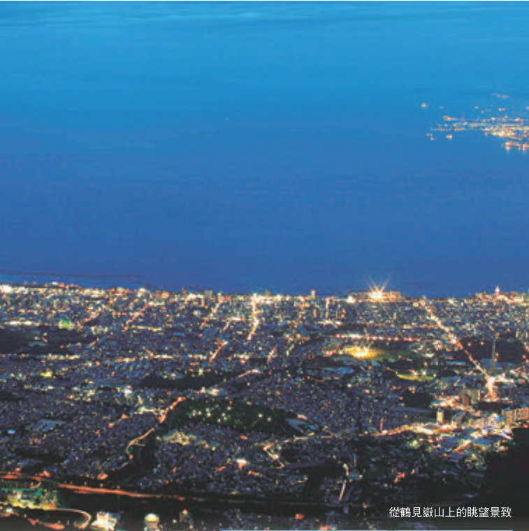
從鶴見嶽山上的眺望景致