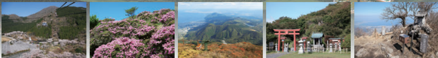
別府高原站周邊的櫻花（4月） 鶴見嶽山上的深山霧島杜鵑（5月中旬~6月上旬） 從鶴見嶽山上欣賞到的紅葉（10月中旬~11月下旬） 鶴見山上權現一之宮 火男火賣神社上宮