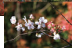
秋季盛開的單層花瓣冬櫻