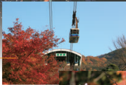
鶴見嶽山麓的紅葉