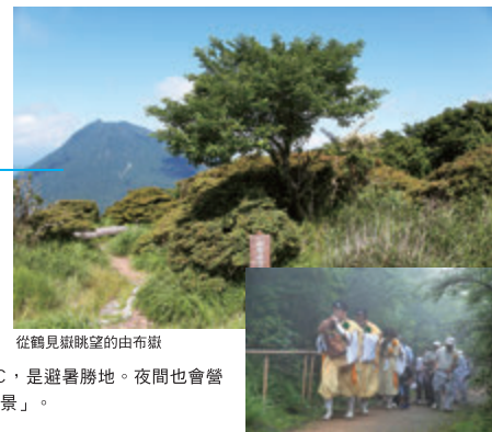
從鶴見嶽眺望的由布嶽

山上的氣溫比平地約低10°C，是避暑勝地。夜間也會營業，可以在山上欣賞美麗的「夜景」。